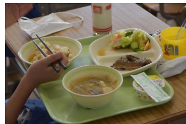
バランスの取れた給食

子どもたちの健やかな成長には「食育」は大切な取り組みです。学校給食は食育の「活きた教材」として、重要な役割を担っております。御代田町では子どもたちの健やかな成長の支援及び子育て世帯の経済的な負担を軽減するために、小中学校の給食費無償化事業を財源の一部にふるさと納税を活用して実施しています。