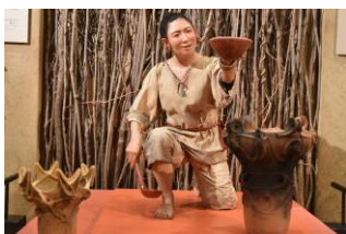
浅間縄文ミュージアム

重要文化財の展示や縄文時代の暮らしを体験できる縄文文化と浅間山をテーマとした博物館です。