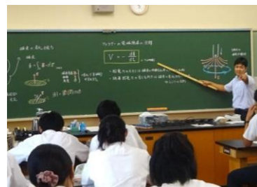
寄付金を活用し購入した黒板

福井県では、ふるさと納税で県内の高校生等を支援する「ふるさと母校応援」に取り組んでいます。応援したい学校を指定し寄付を行うと、寄付額の4/5が当該学校の施設整備や研修活動費に活用され、残りの1/5が、返還不要の給付型奨学金「福井県さぼろ応援奨学金」の財源として活用されます。また令和4年度からは新たに、学校があらかじめ提案したプロジェクトに対して寄付を募ることで、寄付の全額を学校に交付し、生徒が必要とする事業に活用する「プロジェクト型ふるさと母校応援寄付」を創設し、寄付募集を行っています。