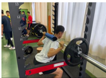
寄付金を活用し購入した部活用具

「ふるさと母校応援」では、部活動の備品購入、学生の短期海外研修など、学校ごとに必要な事業へ寄付金を活用させていただいています。新たに創設した「プロジェクト型ふるさと母校応援寄付」では、部活動のための楽器の購入や修繕、授業の拡充など、各学校が予算の都合でこれまでできていなかった事業を実施することができました。また、「福井県さぼろ応援奨学金」を活用し、学習や学校活動などへの意欲を持った毎年約20人の生徒が高校等へ進学しています。