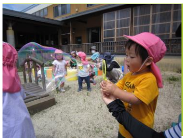
砂遊びとシャボン玉

また、保育園入園への経済的ハードルを下げたことにより、より利用しやすい環境が整備され、多くの児童を受け入れることができました。このことにより、保護者の早期復職や、育児ストレスの軽減といった効果にもつながっています。